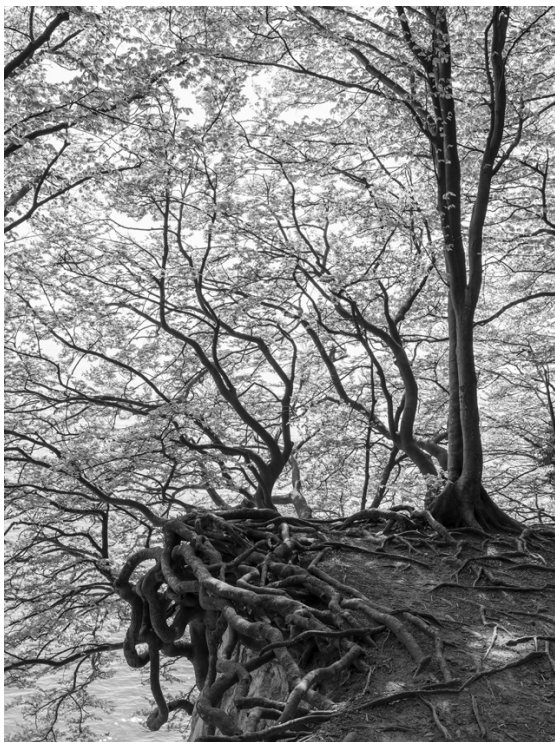
Graubaum 68, 2023